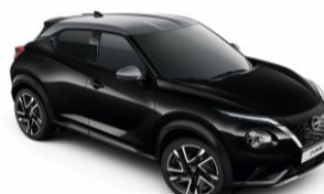
Fekete / Ezüst YAY - 300 000 Ft