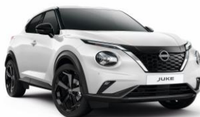
Gyöngyházfehér QBE - 190 000 Ft