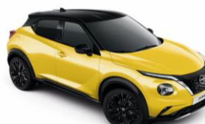
Sárga / Fekete YAS - 300 000 Ft