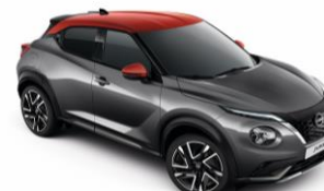
Szürke / Piros XFB - 300 000 Ft