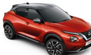
Piros / Ezüst XEZ - 300 000 Ft