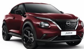
Burgundi NBQ - 160 000 Ft