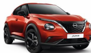
Naplemente vörös NBV - 160 000 Ft