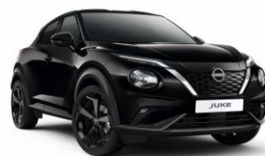
Gyöngyházfekete GAT - 160 000 Ft