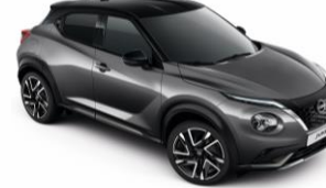
Szürke / Fekete GAQ - 300 000 Ft