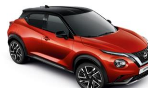
Piros / Fekete YAU - 300 000 Ft