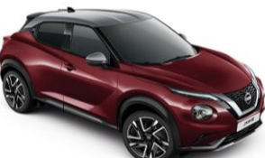
Burgundi / Ezüst XEE - 300 000 Ft