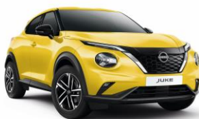
Sárga ECE - 160 000 Ft