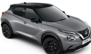
Szürke / Fekete XEX - 300 000 Ft