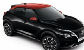
Fekete / Piros YAX - 300 000 Ft