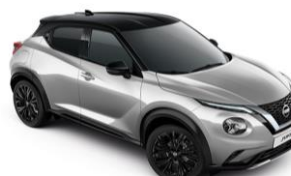
Ezüst / Fekete YAV - 300 000 Ft