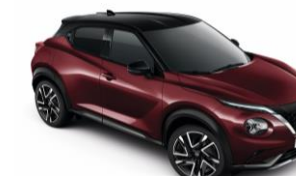
Burgundi / Fekete XDO - 300 000 Ft