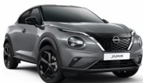
Gyöngyházsürke KBY - 160 000 Ft