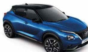
Élénkkek / Fekete XGZ - 300 000 Ft