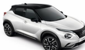
Fehér / Fekete XKJ - 300 000 Ft