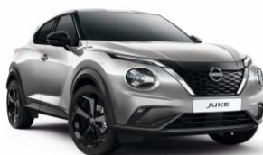
Ezüst KYO - 160 000 Ft